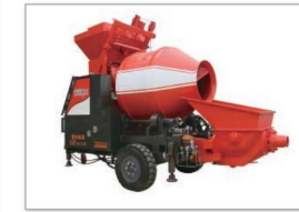
搅拌拖泵 Drag the mixing pump