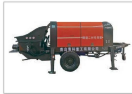
隧道二衬专用泵 Tunnel second line special pump