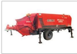
混凝土湿喷机 Concrete wet spraying machine