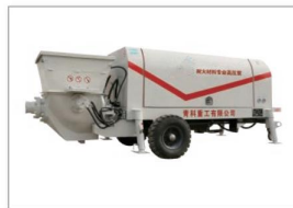
耐火材料专用高压泵 Ultra-high pressure spray pump