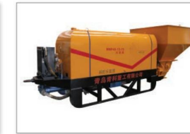
污泥、煤泥泵 Sludge, coal slurry pump