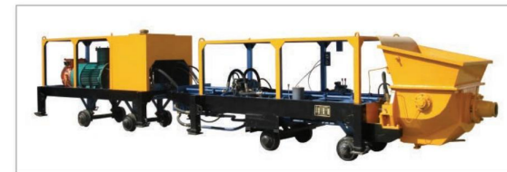
矿用泵 Mine pump