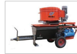
MPS55喷浆机 MPS55 shotcrete machine