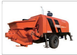
柴油系列混凝土泵 Diesel engine series concrete pump