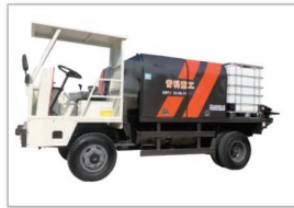
QSPJ20B-08-37车载式双喷头湿喷机 QSPJ20B-08-37 vehicle-mounted double-nozzle wet spraying machine