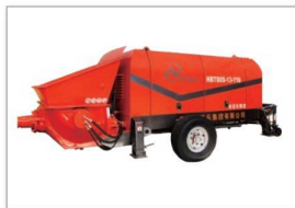
HBT系列混凝土泵 HBT series concrete pump