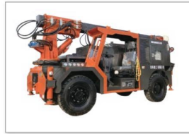
QKSP-20C混凝土湿喷台车 QKSP-20C Wet concrete spraying pump