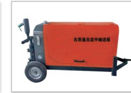
石青基自流平设备 Hydraulic self leveling equipment