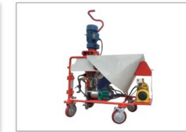
N5喷浆机 N5 Shotcrete machine