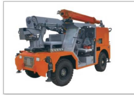
QKSP-20A混凝土湿喷台车 QKSP-20A Wet concrete spraying pump