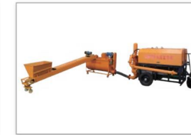
水泥发泡机 Cement foaming machine