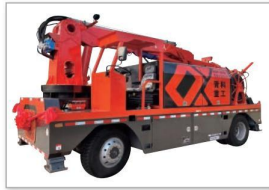
QZHP-3016E混凝土湿喷台车 QZHP-3016E Wet concrete spraying pump