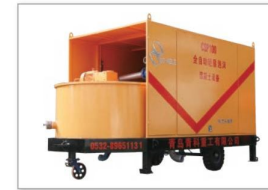
轻质土(发泡混凝土)制备设备 Light soil (foam concrete) preparation equipment