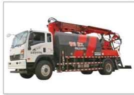
QHP3016(KNL5160TPJ)混凝土湿喷台车 QHP3016(KNL5160TPJ) Wet concrete spraying pump