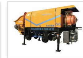
矿用混凝土湿喷机 Mine concrete wet spraying machine