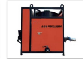
液压式自流平设备 Hydraulic self leveling equipment