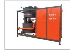
ZJB-20A自流平搅拌输送泵 ZJB-20A Self leveling conveying pump