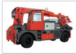
QZHP-3016B混凝土湿喷台车 QZHP-3016B Wet concrete spraying pump