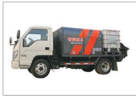
QSPJ20A-08-37车载式双喷头湿喷机 QSPJ20A-08-37 vehicle-mounted double-nozzle wet spraying machine