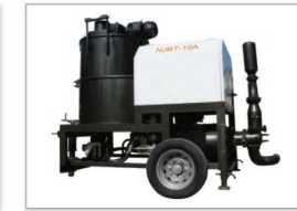
NJBT-10A灌浆泵 NJBT-10A Grouting pump