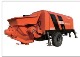
XBS系列混凝土泵 XBS series concrete pump