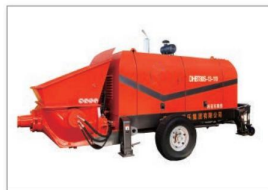
柴油系列混凝土泵 Diesel engine concrete pump