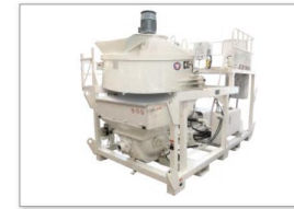
耐火材料搅拌输送泵 Fireproof mixing and delivering pump