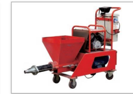
N2喷浆机 N2 Shotcrete machine